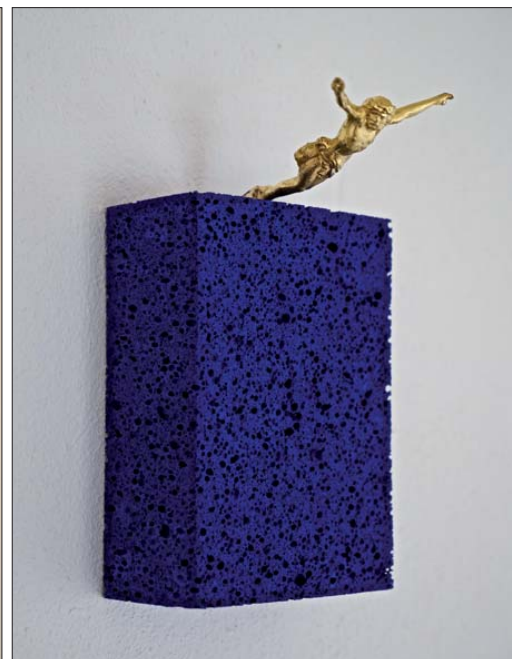
Le Saut dans le Vide (2015)