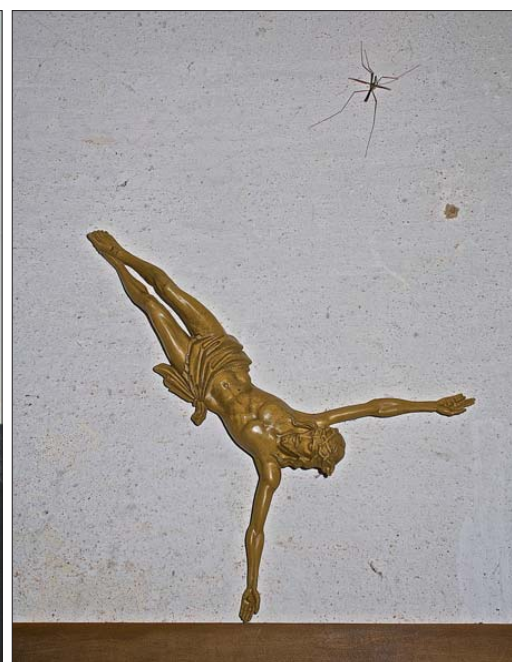
Air Traffic Controller (2015)