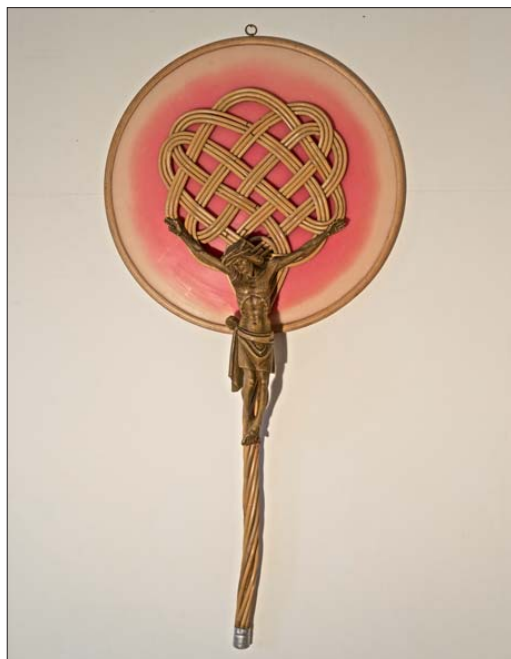
Celtic Symphony (2013)